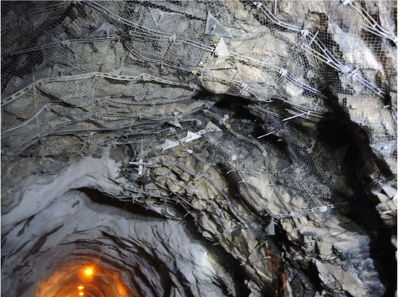
Foto 2: Oversiktsbilde på svakhetssone. Nettet anbefales å klippes opp ved sonen for å montere fendrende sikring i form av PE-skum. Områder med mye småstein bak nett samt områder med stort avstand mellom nett og berg anbefales også å klippes opp. Partiet sprøytes etterpå med fiberarmert sprøytebetong (10 cm i heng/vederlag og 8 cm i vegger) og boltes til sist med c/c 2 m (4 m lange bolter i heng og 3 m lange bolter i veggene).