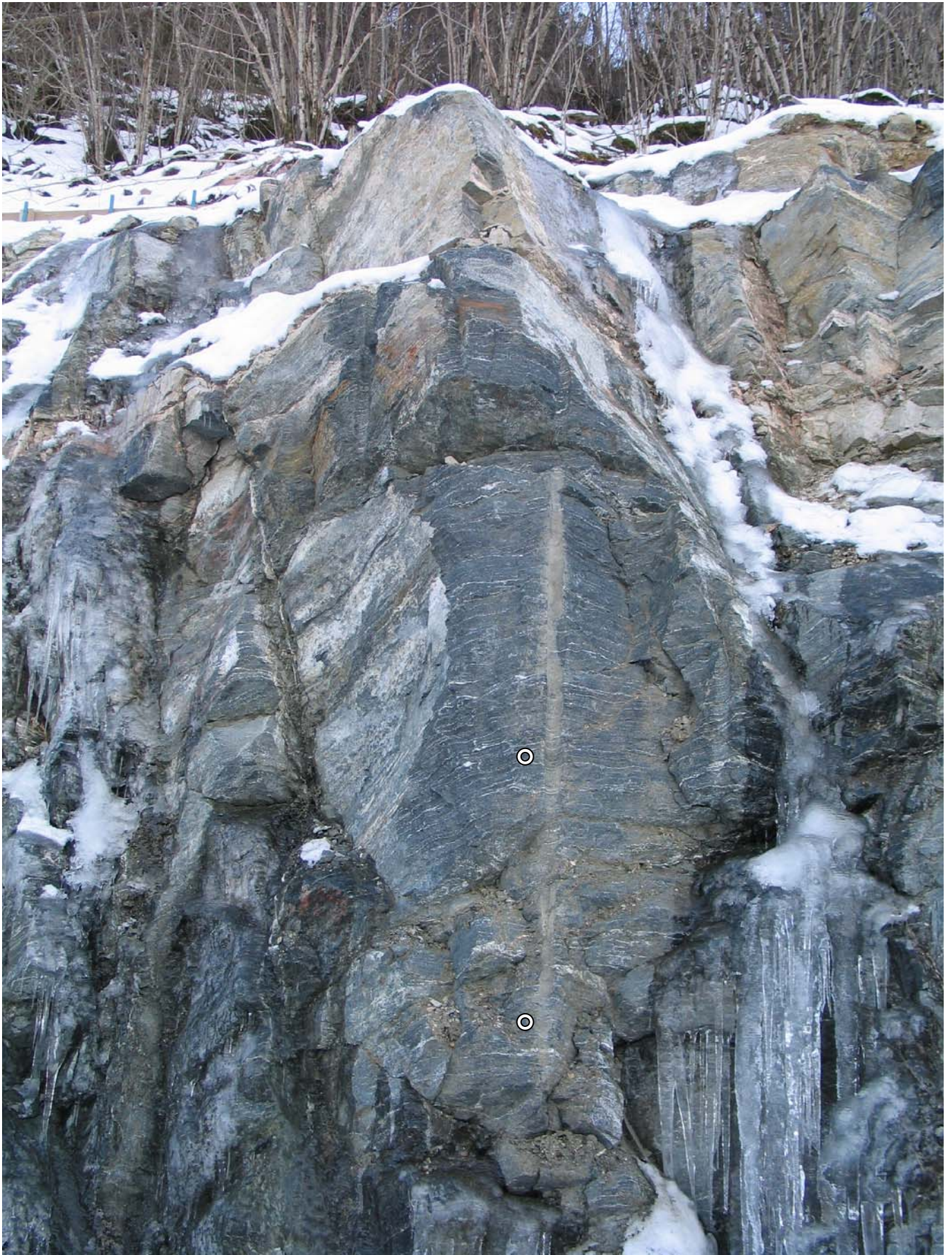
Kile som støtter ovenforliggende blokk, må sikres med 2 stk. bolter lengde 2,4 m.