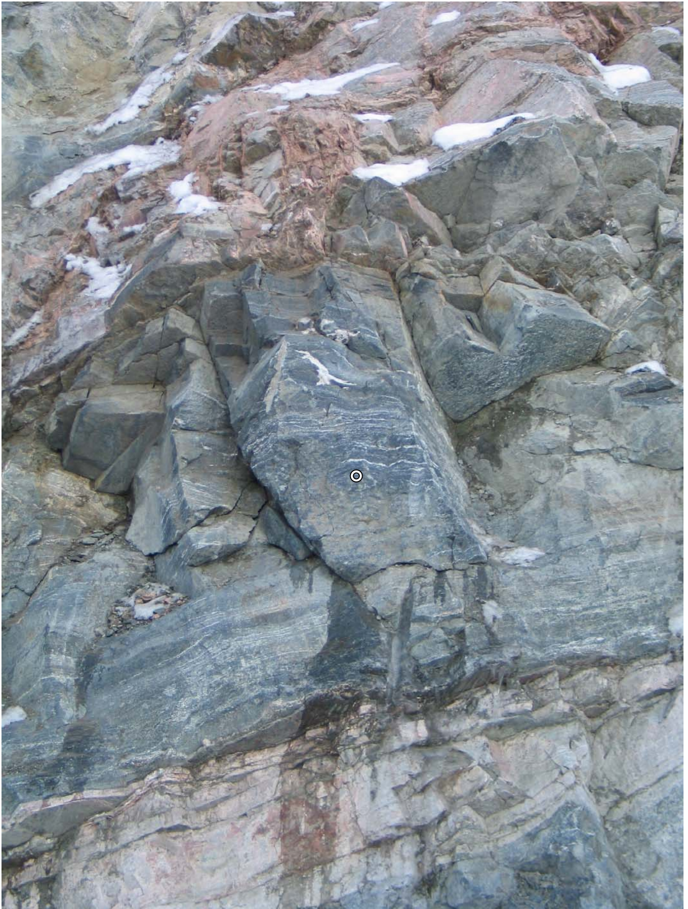
Blokk som støtter ovenforliggende forvitret masse, må sikres med 1 bolt lengde 2,4 m.